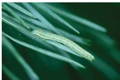
Raupe des Kiefernspanners

Wie bei zurückliegenden Schadereignissen des Kiefernspanners festgestellt, bedeutet starker Flug nicht zwingend, dass in Folge starke Fraßschäden auftreten.