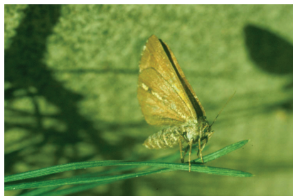
Kiefernspanner ( Bupalus piniarius ) Weibchen

Wie bereits berichtet, gab es eine Massenvermehrung des Kiefernspinners in den Jahren 2007 und 2008. Langzeitauswertungen lassen einen etwa 10-jährigen Rhythmus von Gradationen des Kiefernspinners erkennen.