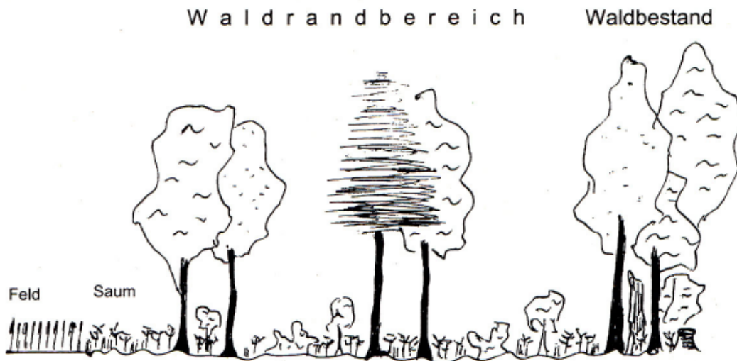
Abb. 2: Aufbau eines Mosaikwaldrandes