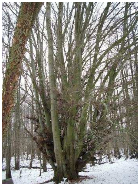
Abbildung 2: sogenannte Hutebuche im FFH- Gebiet "Bretziner Hede"