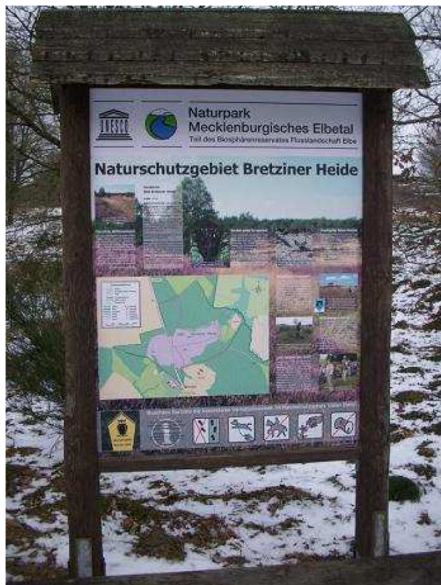
Abbildung 3: Naturschutz- Hinweistafel am Parkplatz des NSG "Bretziner Heide"

Das FFH- Gebiet ist gleichzeitig Bestandteil eines nationalen Schutzgebietes. Es ist in gleicher Flächengröße ein Naturschutzgebiet mit gleichem Namen (MV 162). Die Verordnung zum Naturschutzgebiet ist in Anhang 4.4. enthalten.