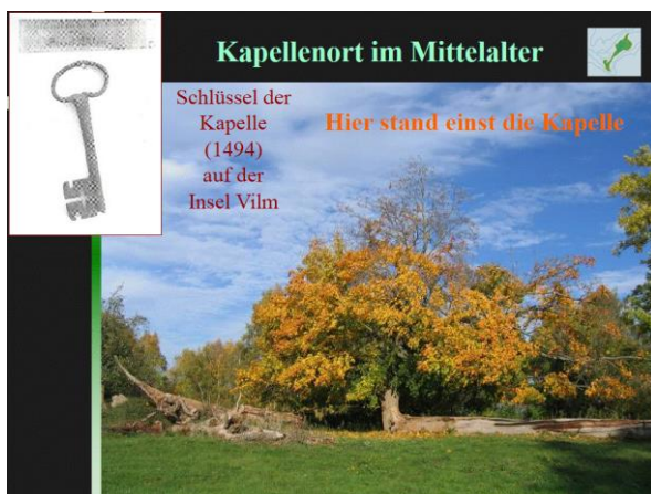
Abb. 3: Standort der mittelalterlichen Kapelle

Die Insel wird erstmals im Jahre 1249 urkundlich erwähnt als Besitz des Hauses Putbus. Ein Jahrhundert später wurde auf der Insel eine Kapelle gestiftet. Drei Mönche des Zisterzienserklosters Eldena, das 1199 am Südufer des Greifswalder Boddens gegründet worden war, werden 1336 als einzige Bewohner der Insel erwähnt. 1396 erhalten vier Einsiedler die Erlaubnis, die wüste Kapelle wieder herzurichten und auf der Insel zu leben. Nach deren Tod verfiel die Kapelle erneut, sie wurde erst 1490 erneuert und 1494 durch den dänischen Bischof von Roeskilde geweiht. Sie war einige Jahrzehnte ein Wallfahrtsort, wurde nach der Reformation in Pommern (1534) aufgegeben und verfiel (HAAS 1924, BUSKE 1994).