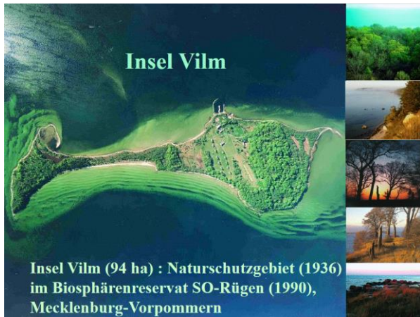
Abb. 1: Die Insel Vilm im Luftbild (1990)