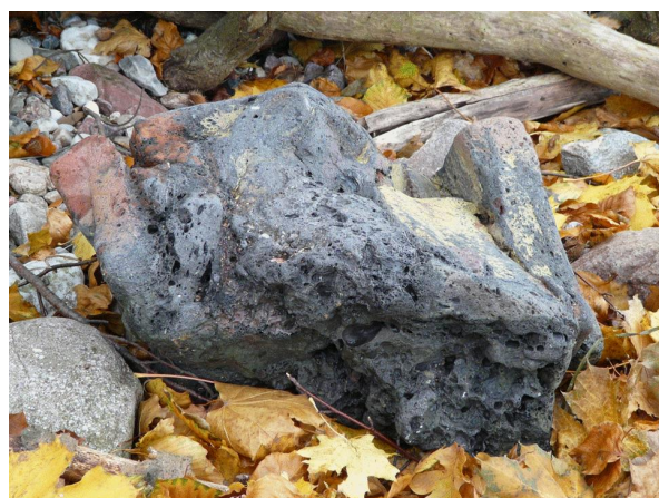
Abb. 4: Rest eines Schmelzofens am Ufer des Kleinen Vilm, gefunden von H. Just & J. Martin 2010