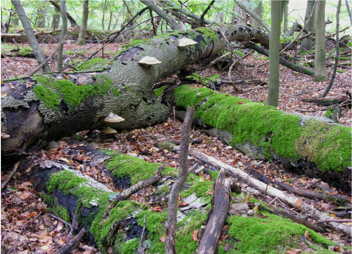
Abb. 5: NSG Heilige Hallen bei Feldberg, der älteste Buchenwald in Deutschland ist seit Mitte des 19. Jahrhunderts von Holznutzung befreit