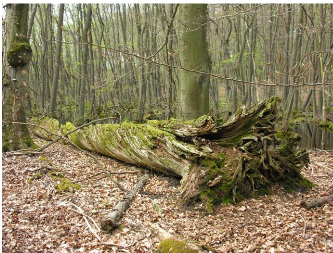
Abb. 4: Die Drehkiefer im Plagefenn 2011