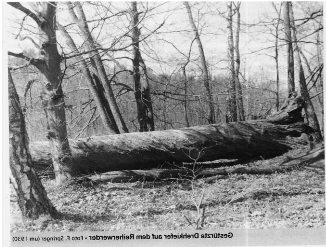
Abb. 2: Drehkiefer Im NSG Plagefenn um 1930 erstmals fotografiert