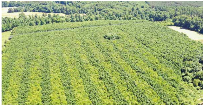
3 Erstaufforstungsfläche Satow 97 – Deutlich ist die reihenweise Pflanzung von Traubeneiche und Buche bzw. im hinteren Bereich der Winterlinde zu erkennen. In den Buchen- oder Winterlindenpartien ist jede fünfte Pflanze eine Hainbuche oder eine Wildkirsche. Alle Baumarten sind auch heute – nach 25 Jahren – noch vorhanden!