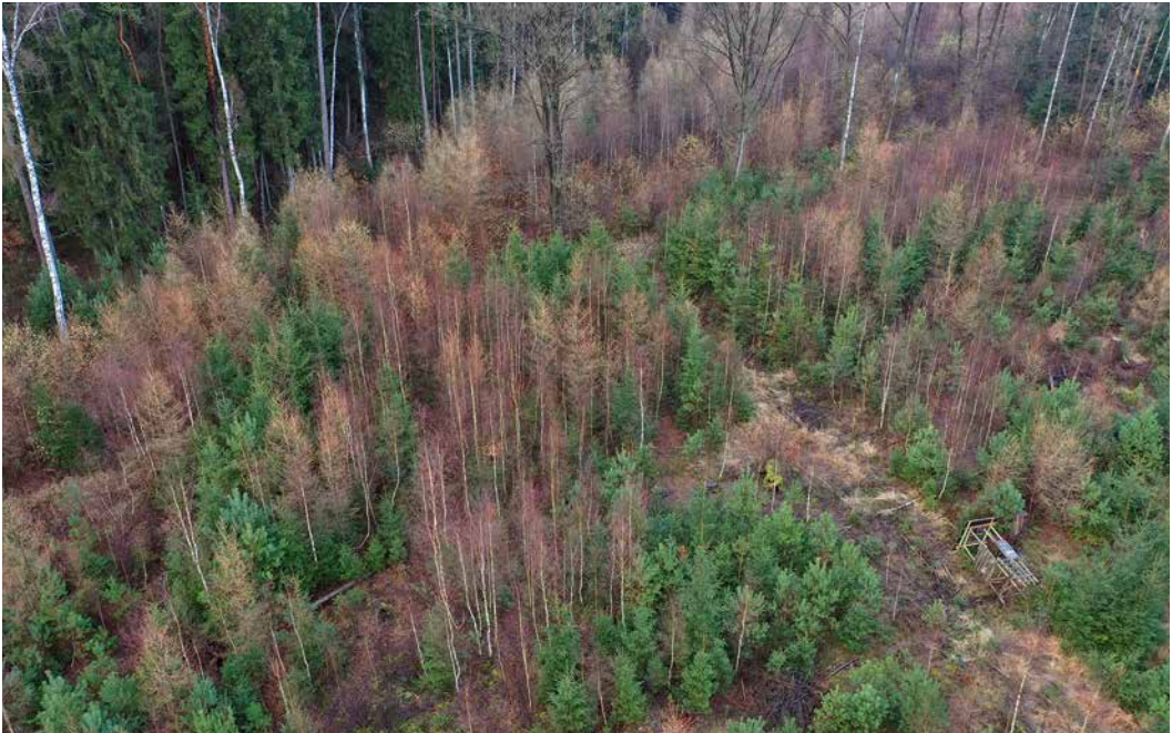
1 Mit Naturverjüngung und Pflegeaufwand können auch bei Lichtbaumarten (Birke, Lärche, Kiefer) sehr innige Mischungen vollzogen werden. (E. Thurm)