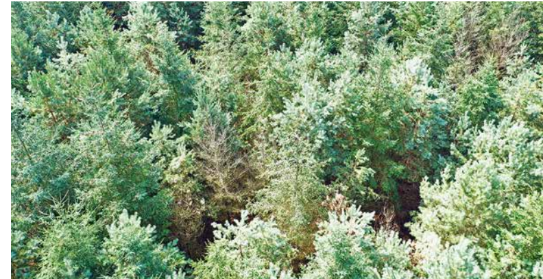
2 Aus der Vogelperspektive sind die Buchen kaum noch zu erkennen in dem Kiefern-Douglasien-Buchen-Bestand. Hier ist eine aktive Förderung der Buchen notwendig, um auch weiterhin alle Baumarten am Bestandaufbau zu beteiligen (Versuchsfläche Ruthenbeck 99).

Die Konsequenz ist – Macht Mischungsabstände minimal – und somit landet man folglich bei einer einzelbaum- bis truppweisen Mischung.